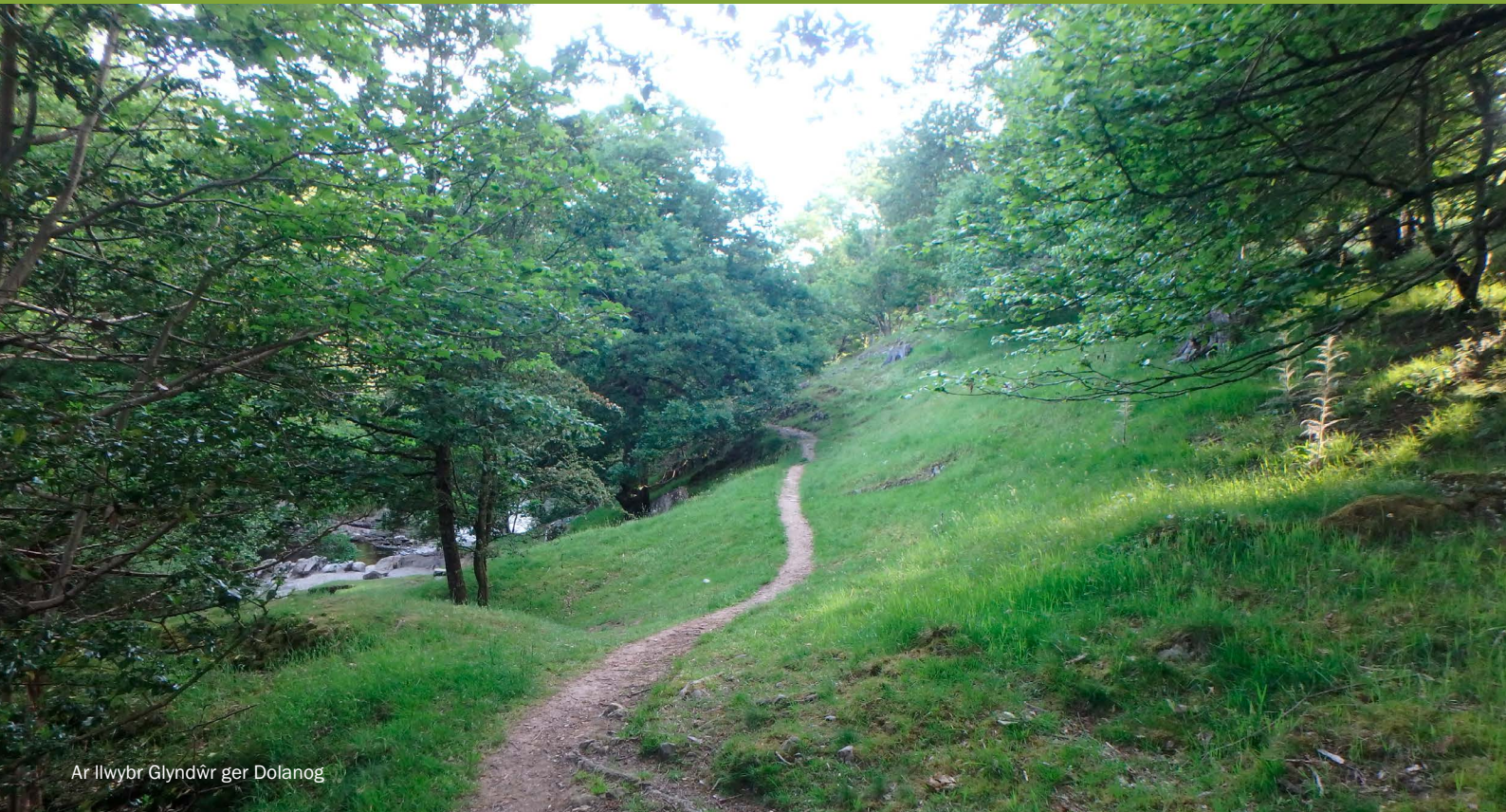
Ar Llwybr Glyndŵr ger Dolanog