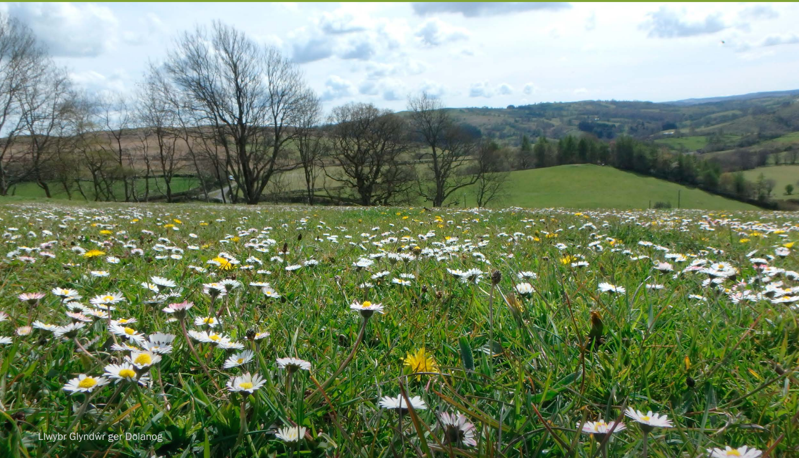
Llwybr Glyndŵr ger Dolanog