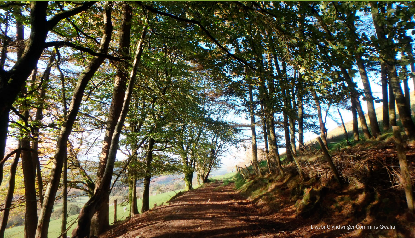
Llwybr Glyndŵr ger Commins Gwalia